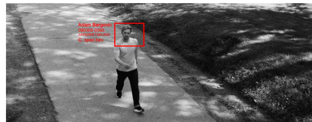
Ur kortfiktionen 2034 av Richard Desiatnik.