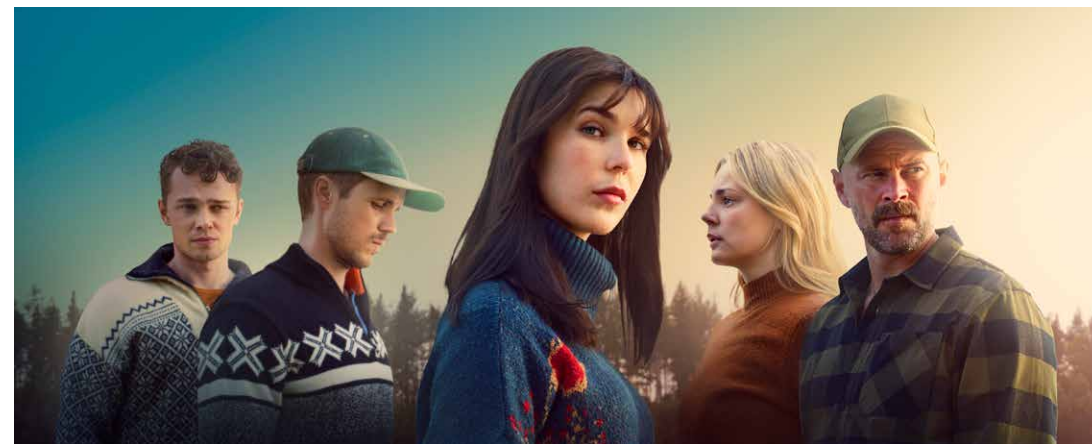
Tv-serien Tystnaden i regi av Therese Lundberg.

Vi vill att unga norrbottningar ska känna: jag kan också ta plats, gå ut i världen, och berätta min historia med filmens språk. Och när de gör det blir vi andra också inbjudna – till ännu en ny värld, ännu en resa.