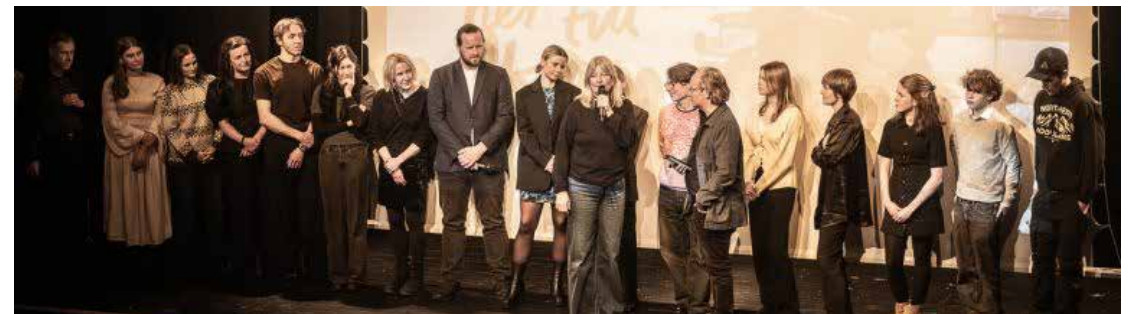
Scensamtal i samband med Norrbottenspremiären av tv-serien Jag for ner till Bror i Råneå.

Men året var inte bara fyllt av fina framgångar och publika succéer. Verkligheten var också att beställningarna på tv-serier och filmer blev färre i hela landet, streamingaktörerna försiktigare, plånböckerna i alla led – nationellt och regionalt – tunnare i film- och tv-branschen. Den statliga