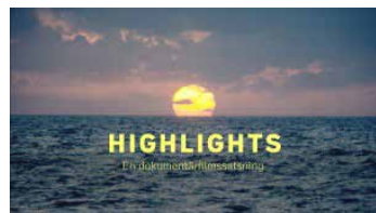
Ett samarbete mellan SVT, Filmpool Nord, Film i Väst och Film i Skåne.

Filmpool Nord, Film i Väst, Film i Skåne och SVT lanserade en ny dokumentärfilmsatsning, HIGHLIGHTS, innan sommaren. I satsningen söktes det 30 minuter långa dokumentärfilmer – berättelser som fångar det samtida innan det försvinner.