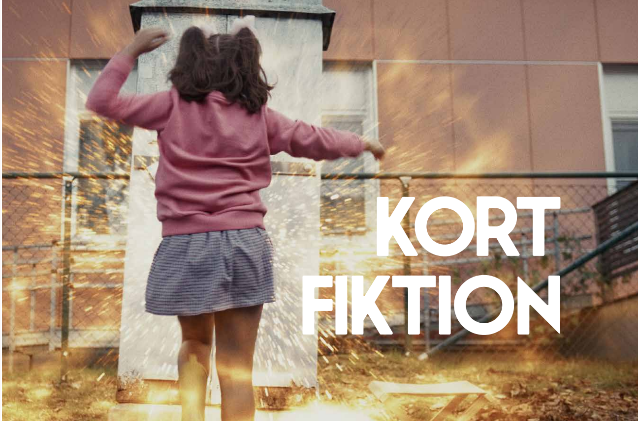
Från kortfilmen Elskåpet i regi av Charissa Martinkauppi.