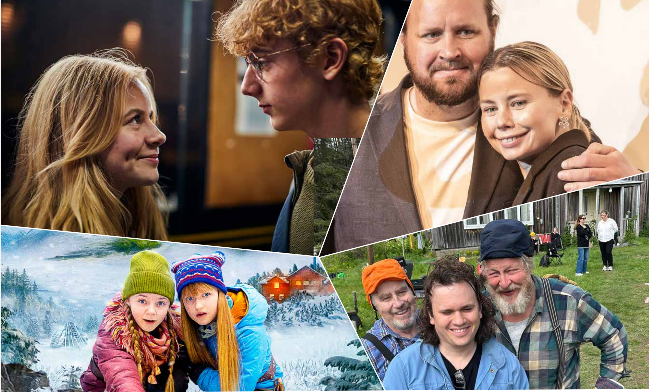
Ur Filmpool Nords samproduktioner: Filmen Bert sabbar allt , tv-serien Jag for ner till Bror , julkalendern Snödrömmar och långfilmen Arne goes to space .