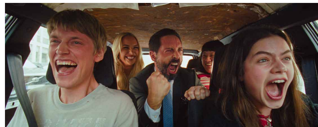
The Dance Club av Lisa Langseth hade biopremiär i september 2025.