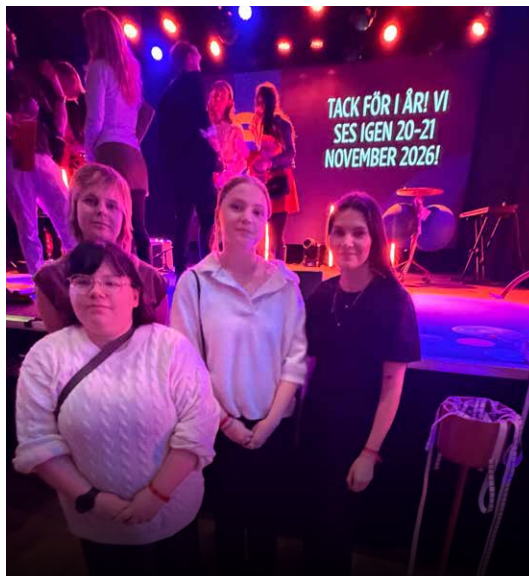
Gänget bakom filmen En chans till på plats i Trollhättan.

Vinnarna i tävlingen Ung Film i Norr blir direkt kvalificerade till den nationella tävlingen Novemberfestivalen där Norrbottensbidrag tävlar i hård konkurrens mot bidrag från hela Sverige. Här tävlade filmen En chans till i kategorin tungvikt då den flyttades upp en kategori på grund av att den tävlat i fel kategori i Ung Film i Norr. Ungdomarna bakom filmen reste till Trollhättan för att medverka vid festivalen och träffa andra filmintresserade från hela Sverige. Det här året blev det inga priser för Norrbottensfilmen men ungdomarna hade en mycket inspirerande och lärorik resa.