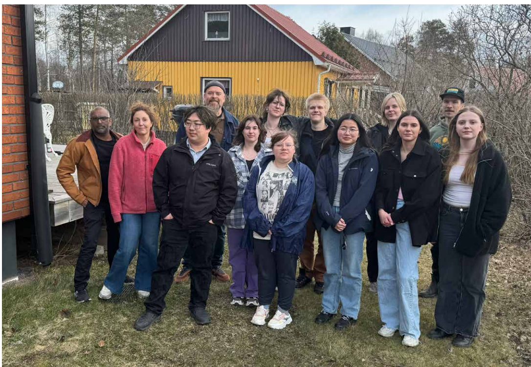
Deltagarna och Filmpool Nords medarbetare från kursen Ung hjärta film 2025.