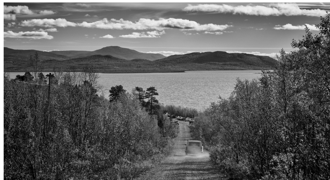
Från dokumentärfilmen Vägen till Ingenstans av Johan Palmgren.

In My Hand vann flera priser under 2025.