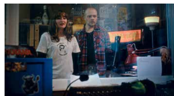
Spökonsdag på radio Kiruna 97.3.

FilmPool Nord hade 2025 tre ansökningsomgångar för kort fiktion och dokumentärfilm, två under våren och en under hösten. Totalt skickades det in