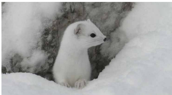
Fyra årstider vid Valkkirkurkioforsen av Håkan Lundström visades under 2025.

– Det har varit roligt att ta pulsen på den svenska dokumentärfilmsaren via HIGHLIGHTS. Dokumentären