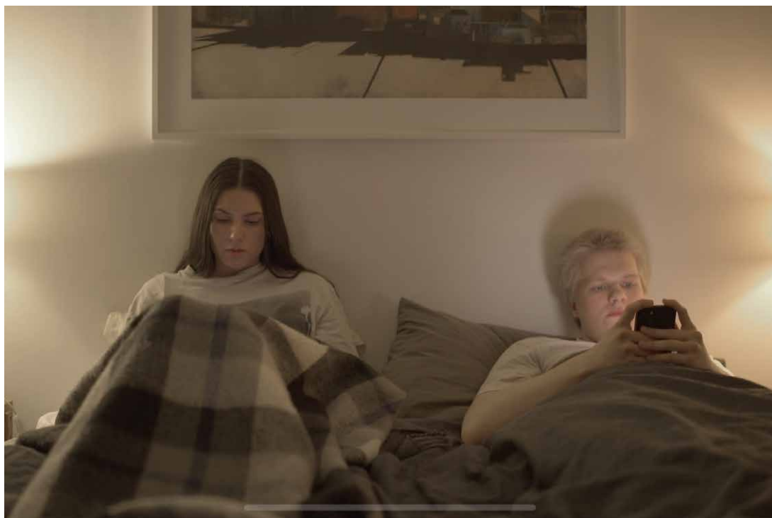
En chans till producerades under kursen Ung Hjärta Film.